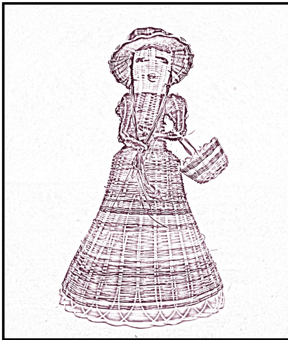
DAMA Artesanía en crin

Rari es una pequeña localidad en la Provincia de Linares donde la mayoría de sus mujeres teje con las fibras de crin de caballo figuras livianas y transparentes de colores naturales como café, negro, gris y crudo o matices teñidos en una amplia gama. El origen de este oficio tiene antecedentes más relacionados con el mito que con hechos concretos, se dice que la artesanía en crin, tiene sus orígenes hace más de doscientos años. Se construye a partir de la observación, a la orilla de un estero, de la raicillas de álamo que formaban en el agua variadas figuras flotantes. Existe también la teoría de que una monja, de origen belga, habría descubierto esta artesanía, inicialmente con raíces de álamo y luego aconsejado el uso de colorantes para esta cestería en miniatura". ( www.memoriachilena.cl )