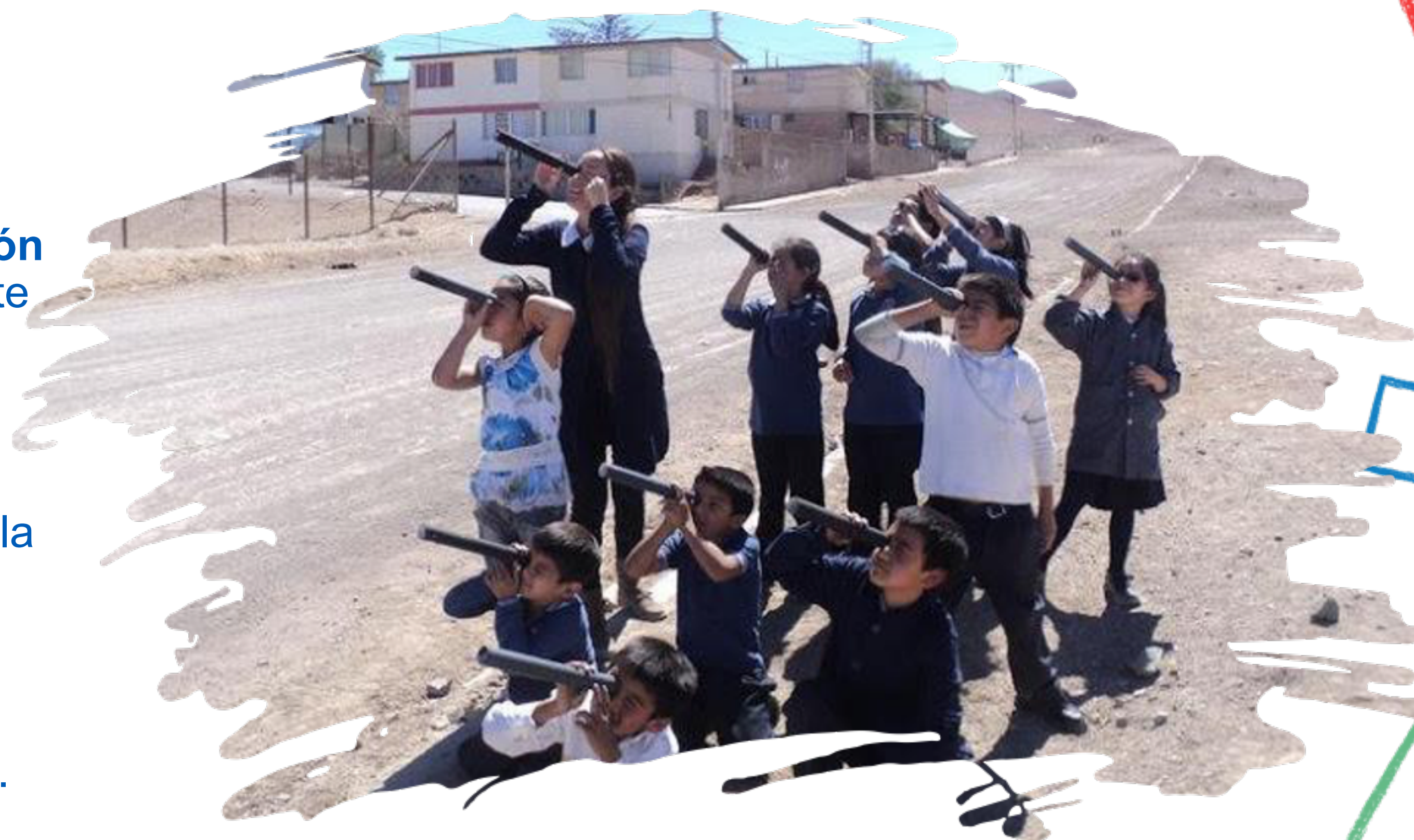
Intervención artística en espacio público. Colegio Dr. Guillermo Velasco Barros. Semana de la Educación Artística 2014.

Tanto el foro como la SEA culminarán en octubre de 2021.