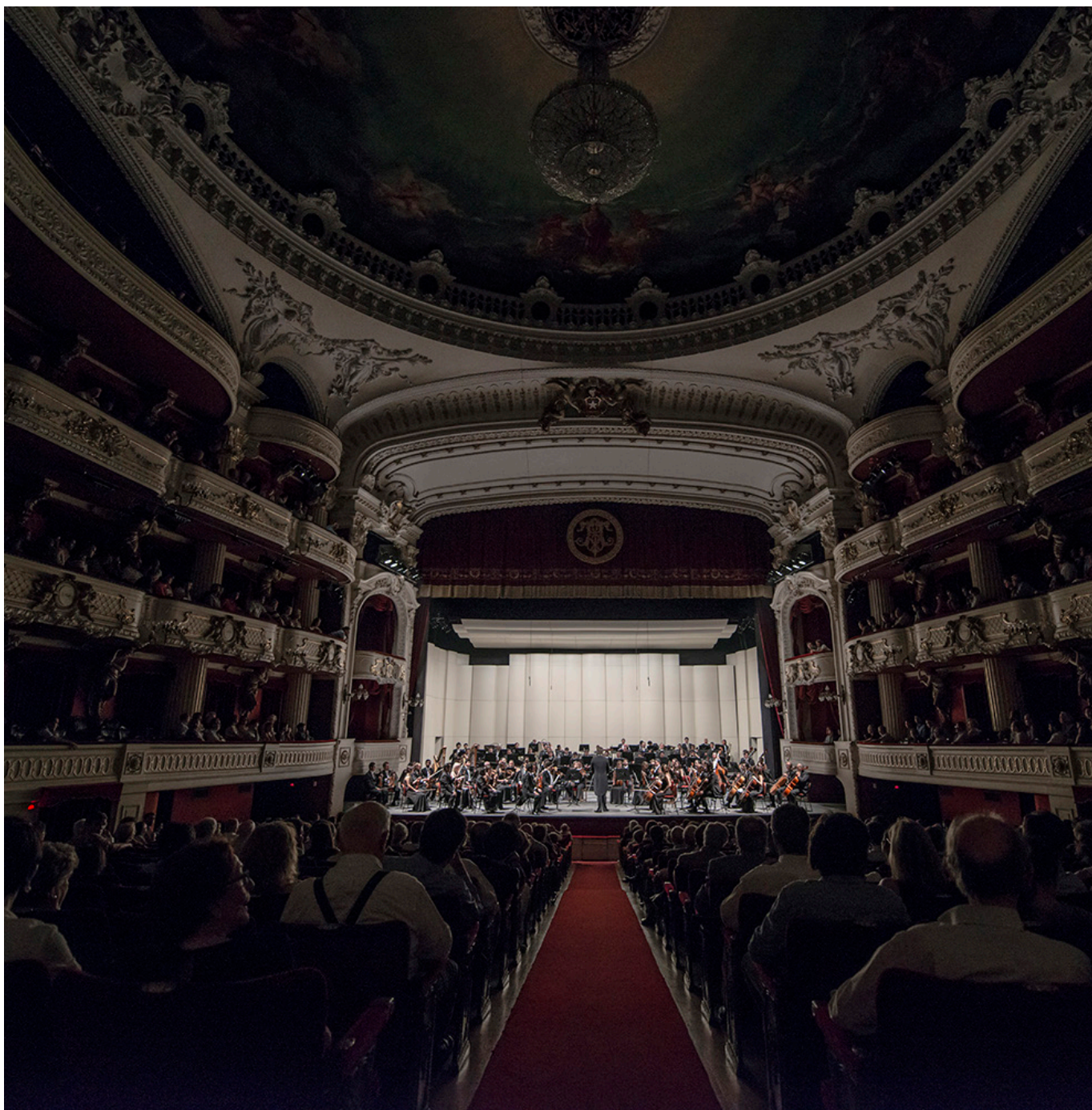
figura del director de orquesta , quien utiliza una batuta para que se vea mejor el gesto de su mano. Es tan importante el rol del director de orquesta, que si se cambia el director, también puede cambiar completamente la obra que estamos escuchando.

El director de orquesta indica el compás, la velocidad ( tempo ), el volumen del sonido (dinámica), las entradas de las diversas secciones de instrumentos y de los solistas. Es el responsable final de la interpretación y su tarea principal consiste en concertar todos los instrumentos.