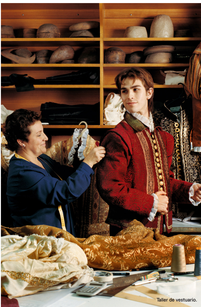
Taller de vestuario.

En el Municipal de Santiago han actuado grandes artistas como Plácido Domingo, Herbert von Karajan, Ramón Vinay, Claudio Arrau, Zubin Mehta, Anna Pavlova y Rudolf Nureyev, entre muchos otros.