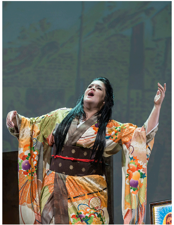
La soprano Keri Alkema en Madama Butterfly (2015)