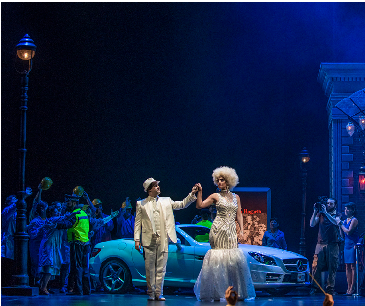
La carrera de un libertino (2015)

El Municipal se inauguró con el montaje de la ópera Ernani de Giuseppe Verdi, en 1857. A lo largo de los años, una gran cantidad de óperas han sido exhibidas en el Municipal y algunos de los mejores cantantes del género, como Beniamino Gigli o Plácido Domingo han venido a Chile a presentarse en este escenario.