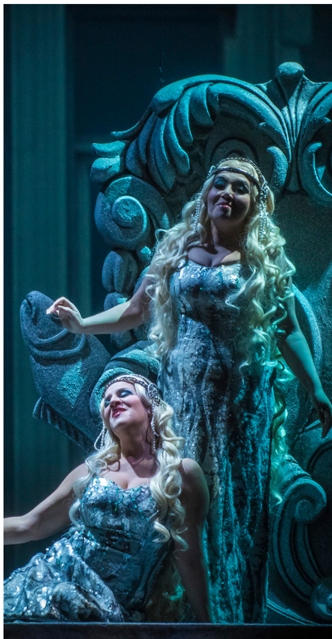
Ópera Rusalka (2015)

Las obras más conocidas fueron escritas en el siglo XIX, pero siguen componiéndose óperas en la actualidad. Además, como es un género propio de las artes escénicas, cada vez que una ópera se monta -a diferencia de una película, por ejemplo- cambian los actores, cantantes, ritmo, escenografía, luces y vestuario. Sólo la música y la letra permanece y eso hace que ésta siempre se renueve.