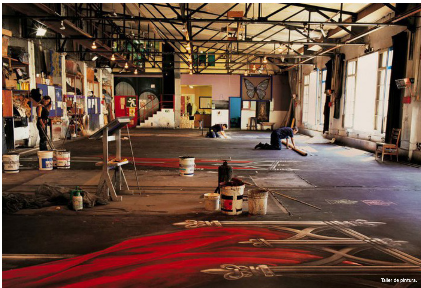
Taller de pintura.